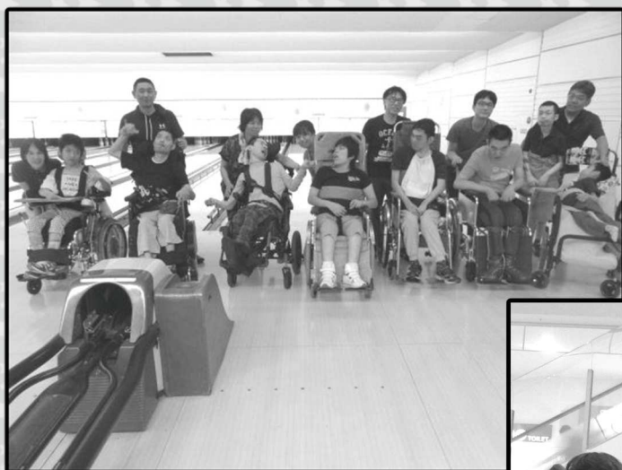
↑ ボウリング外出 (大地の家)